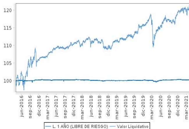
Evolución del valor liquidativo últimos 5 años