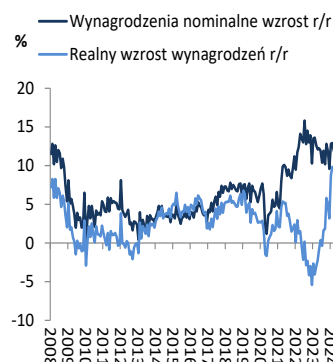
Wykres 1. Przeciętne wynagrodzenie (dynamika r/r)

W III kw. br. realna dynamika PKB została potwierdzona w wysokości -0,1% kw/kw oraz 2,7% r/r. W III kw. br. spożycie w sektorze gospodarstw domowych wzrosło realnie zaledwie o 0,2% r/r (wobec wzrostu o 4,6% r/r w II kw.), spożycie publiczne wzrosło realnie o 4,5% r/r (wobec 11,5% r/r w II kw.) a inwestycje w środki trwałe wzrosły realnie zaledwie o 0,1% r/r (wobec wzrostu o 3,2% r/r w II kw.). W III kw. eksport spadł realnie o 0,7% r/r (po wzroście o 2,9% r/r w II kw.) a import wzrósł realnie o 1,9% r/r (wobec wzrostu o 5,7% r/r w II kw.).