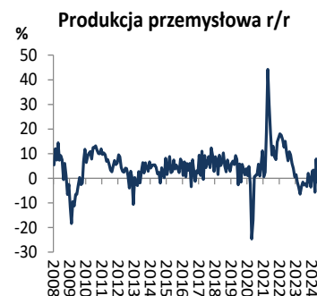
Wykres 2. Produkcja przemysłowa (dynamika r/r)