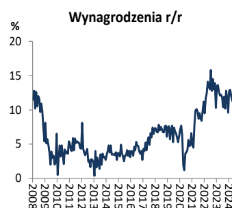
Wykres 1. Przeciętne wynagrodzenie (dynamika r/r)

W lipcu stopa bezrobocia rejestrowanego wzrosła do 5,0% z 4,9% w czerwcu. Według badania rynku pracy stopa bezrobocia w 2 kw. 2024 r. spadła do 2,7% z 3,1% w 1 kw. 2024 r.