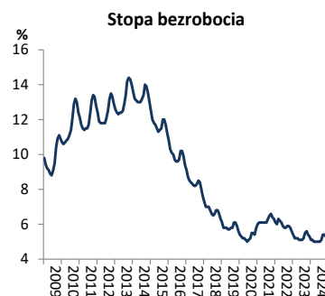
Wykres 3. Stopa bezrobocia rejestrowanego