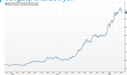
Wykres 2. Rentowność 5-letnich obligacji skarbowych