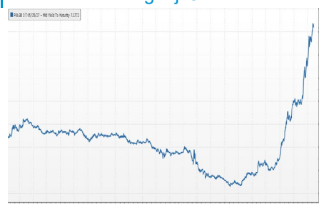
Wykres 3. Długoletni trend – rentowność obligacji 5-letnich SP