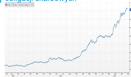
Wykres 2. Rentowność 5-letnich obligacji skarbowych