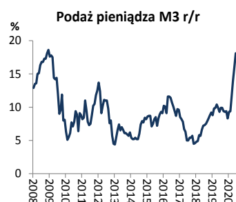
Wykres 2. Podaż pieniądza M3 (dynamika r/r)