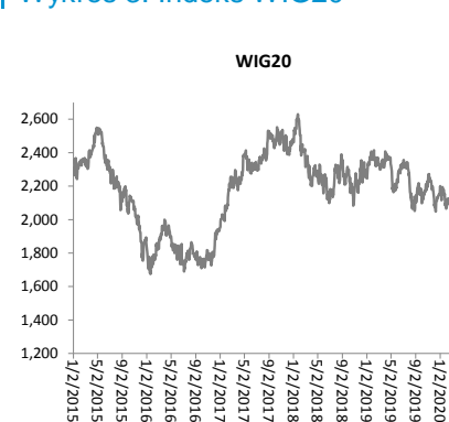
Wykres 3. Indeks WIG20