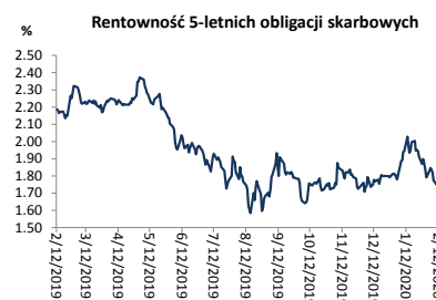
Wykres 2. Rentowność 5-letnich obligacji skarbowych