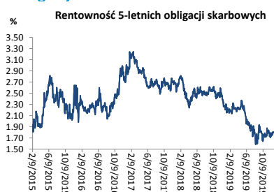
Wykres 3. Długoletni trend – obligacje 5-letnie SP