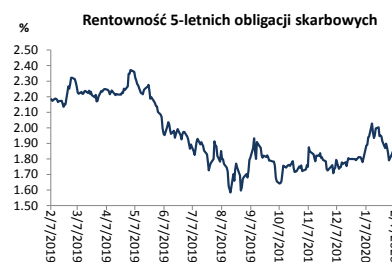
Wykres 2. Rentowność 5-letnich obligacji skarbowych