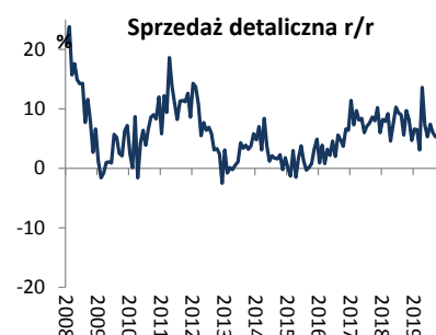
Wykres 3. Sprzedaż detaliczna (dynamika r/r)