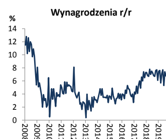
Wykres 1. Przeciętne wynagrodzenie (dynamika r/r)

Stopa bezrobocia rejestrowanego w grudniu 2019r. wzrosła do 5,2% z 5,1% w listopadzie, zgodnie z oczekiwaniami rynku. We środę GUS poda dynamikę PKB za 2019r. (nasza prognoza to 4,2%).