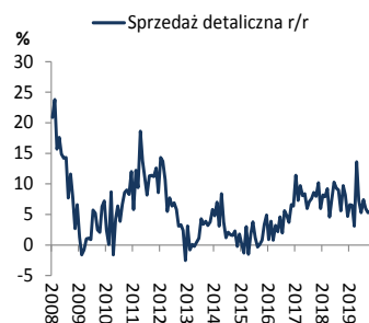
Wykres 2. Sprzedaż detaliczna (r/r)