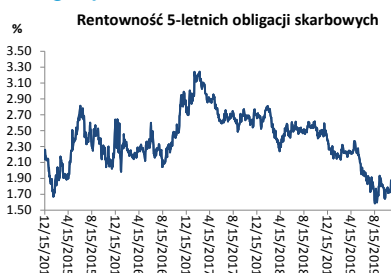
Wykres 3. Długoletni trend – obligacje 5-letnie SP