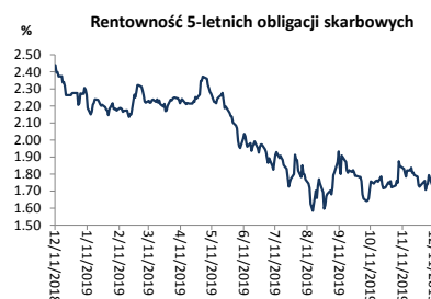
Wykres 2. Rentowność 5-letnich obligacji skarbowych