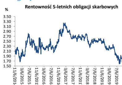
Wykres 3. Długoletni trend – obligacje 5-letnie SP