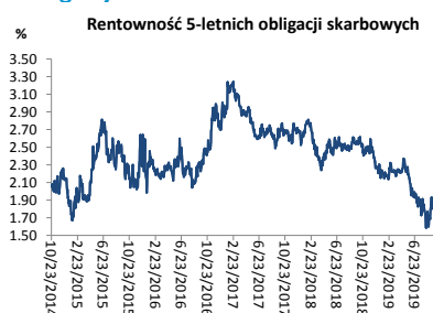
Wykres 3. Długoterminny trend – obligacje 5-letnie SP