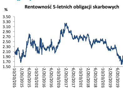
Wykres 3. Długoterminny trend – obligacje 5-letnie SP