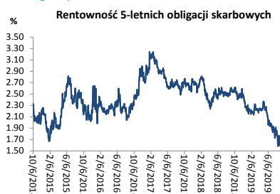
Wykres 3. Długoletni trend – obligacje 5-letnie SP