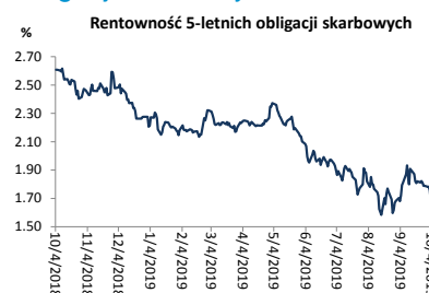
Wykres 2. Rentowność 5-letnich obligacji skarbowych