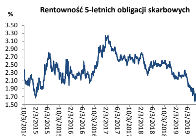
Wykres 3. Długoterminny trend – obligacje 5-letnie SP