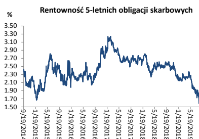
Wykres 3. Długoterminny trend – obligacje 5-letnie SP