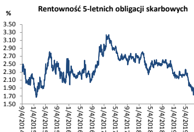
Wykres 3. Długoletni trend – obligacje 5-letnie SP