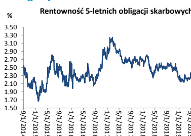
Wykres 3. Długoletni trend – obligacje 5-letnie SP