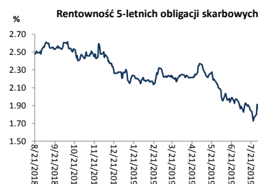
Wykres 2. Rentowność 5-letnich obligacji skarbowych