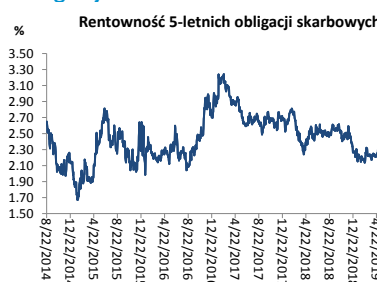
Wykres 3. Długoterminny trend – obligacje 5-letnie SP