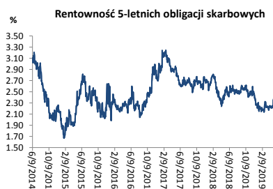
Wykres 3. Długoletni trend – obligacje 5-letnie SP