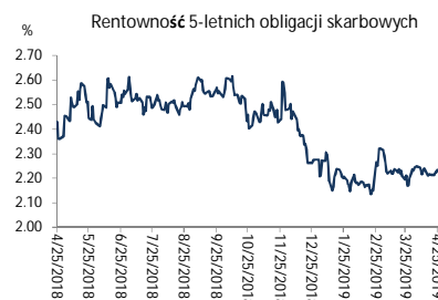
Wykres 2. Rentowność 5-letnich obligacji skarbowych