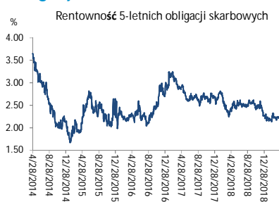
Wykres 3. Długoterminny trend – obligacje 5-letnie SP