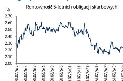
Wykres 2. Rentowność 5-letnich obligacji skarbowych