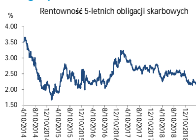
Wykres 3. Długoterminny trend – obligacje 5-letnie SP