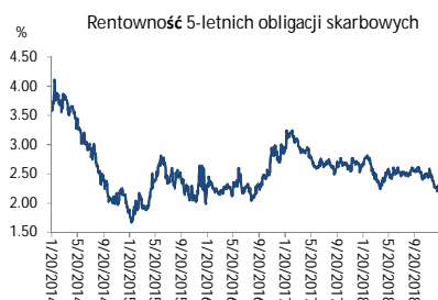
Wykres 3. Długoletni trend – obligacje 5-letnie SP